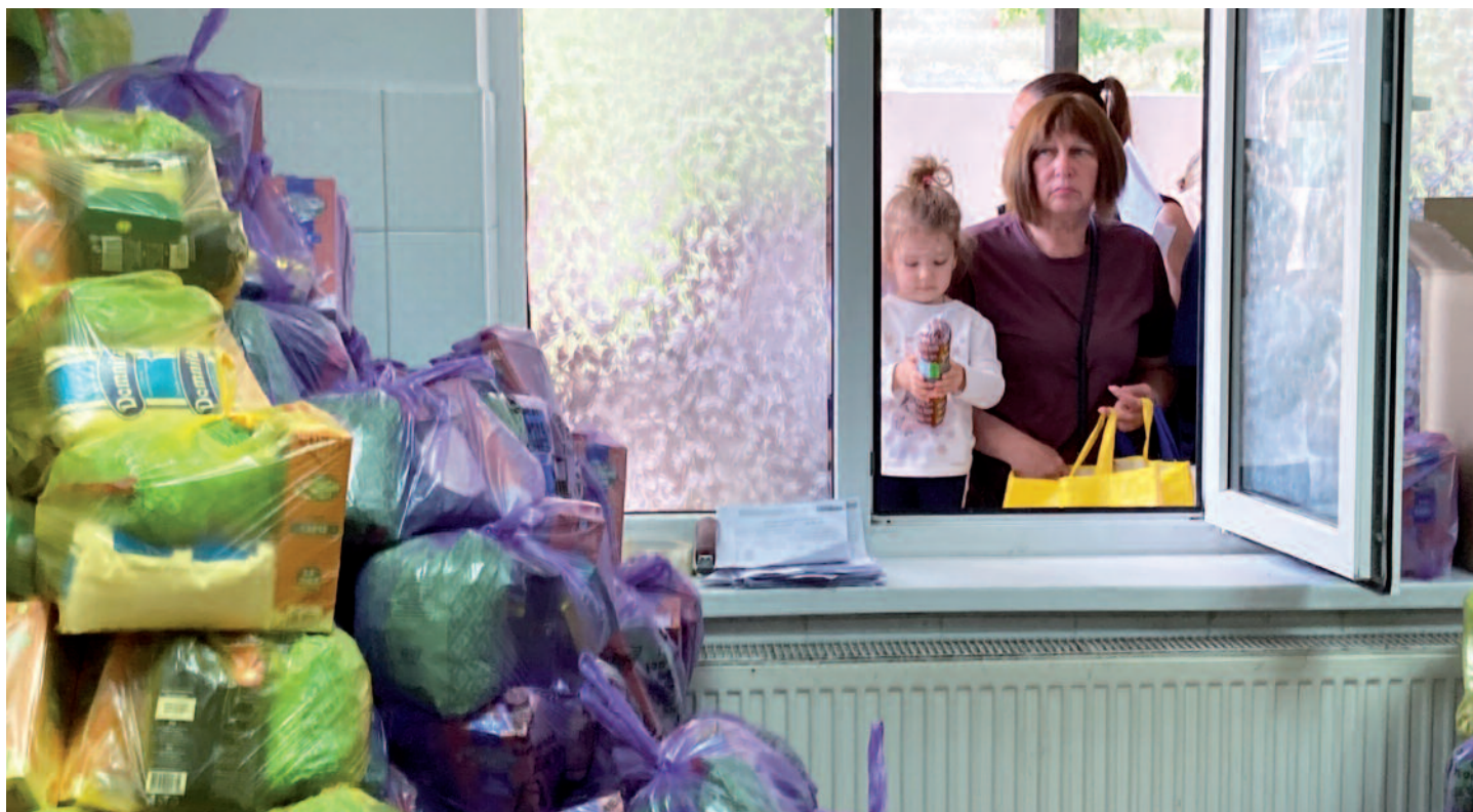
Les familles réfugiées viennent chercher leur sac de nourriture deux fois par semaine au centre Regina Pacis de Chisinau (Moldavie).

Tous les diocèses gréco-catholiques ukrainiens et les communautés religieuses sont en première ligne pour aider la population et les millions de déplacés, matériellement et spirituellement, alors même que la plupart sont orthodoxes. Une leçon d'œcuménisme !